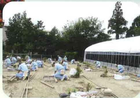
造園技能検定練習