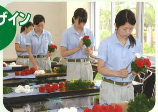
フラワー アレンジメント