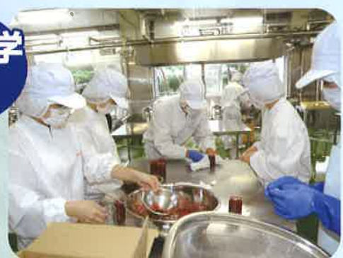
イチゴジャム製造