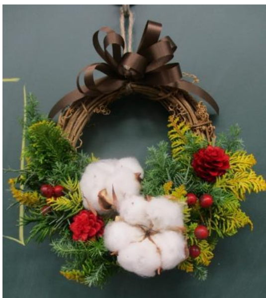
(12/7) 作品1：クリスマスリース