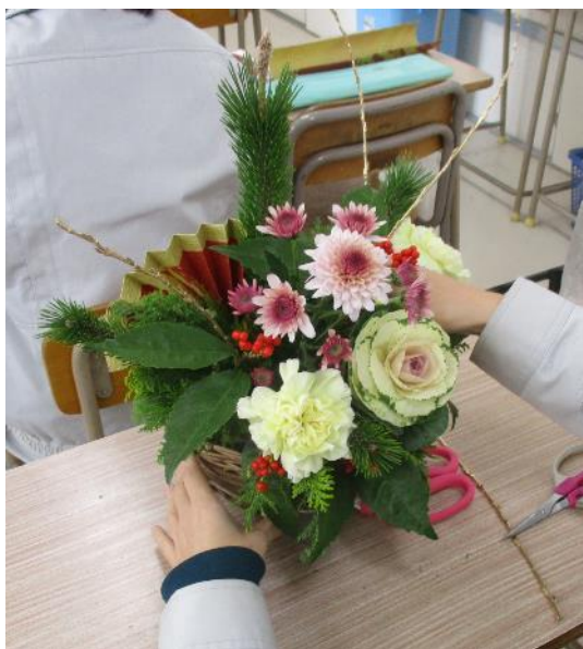
(12/21) 作品3：正月飾り 正月飾りのかごもつるで作りました。