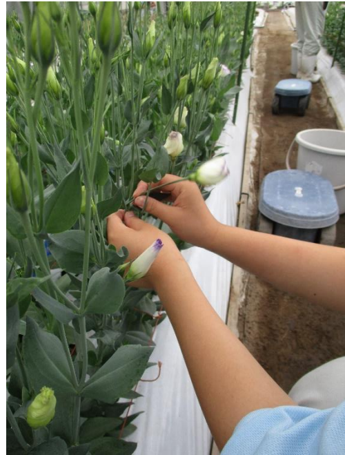
手作業で慎重に摘みます