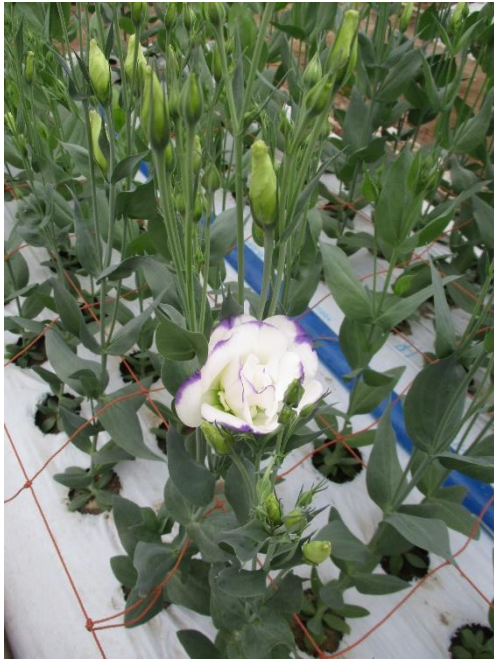
まだ蕾が多い中、開花した1花