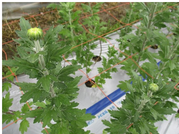
蕾が色付き始めた一輪咲きの菊